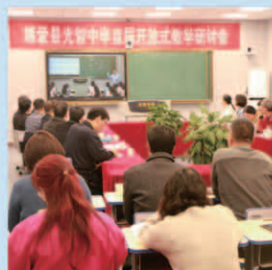
举行首届开放式教学研讨会

学校拥有办公楼、教学楼、学生餐厅、公寓楼、实验楼、科技楼（在建）、报告厅（在建）、足球场、篮球场等标准化建筑场馆，建筑面积近4万平方米。学校目前有在校生2500名，专任教师182名，其中高级教师41名，县级以上名师27名。