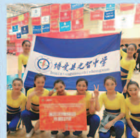
啦啦操获河南省运动会特等奖