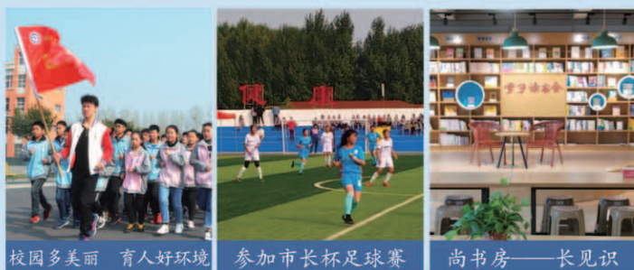
校园多美丽 育人好环境