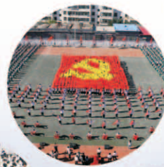
《我和我的祖国》快闪活动