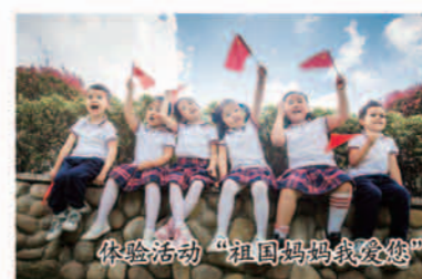
体验活动“祖国妈妈我爱您”