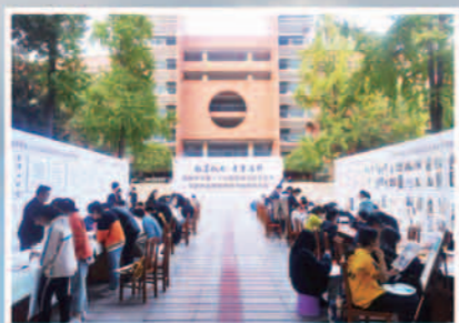
艺术节现场书画比赛