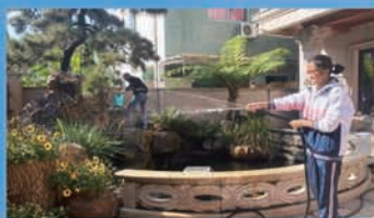
民族教育：“我在顺德有个家——孝德教育感恩父母”主题活动