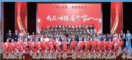
民族教育：“我在顺德有个家——第四届结对仪式晚会”合照

学校先后被评为教育部“国防教育特色学校”“全国青少年校园排球特色学校”“全国生命教育百佳学校”“广东省依法治校示范学校”“广东省规范汉字书写教育特色学校”“广东省青少年校园足球推广学校”“广东省安全文明校园”“佛山市艺术传承学校”“顺德区先进学校”。2018年，西藏自治区教育厅授予江义中学“民族团结进步学校”称号。