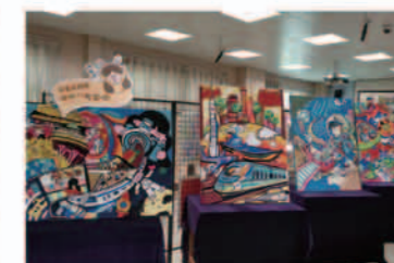
班级艺术节学生作品

“教育是事业，事业的意义在于献身；教育是科学，科学的价值在于求真；教育是艺术，艺术的精髓在于创新！”“没有最好，只有更好”“追求第一，永远向上”永远是“一实验人”的奋斗目标！