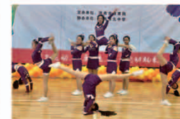
获“济南市健美操比赛”特等奖