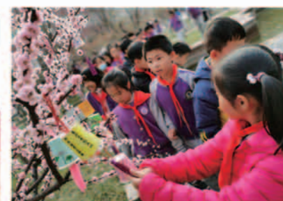
“花朝节”弘扬传统文化

学校教育教学蒸蒸日上，各方面发展取得了辉煌骄人的成绩：荣获“全国百家书香校园”“全国教育信息化示范基地”“全国生态文明教育特色学校”“全国中学生生物竞赛金牌学校”“全国青少年校园足球活动网点学校”“全国五四红旗团总支”“山东省文明单位”“山东省规范化学校”“山东省地震科普示范学校”“山东省重点课题‘阅读中外经典，享受读书乐趣’实验学校”“山东省学生营养宣传工作好单位”“济南市课改先进学校”“济南市依法治校示范校”“济南市文明校园”“济南市教育系统先进集体”等荣誉。