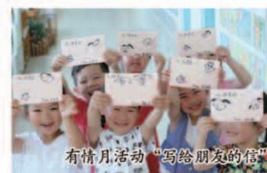
有情月活动“写给朋友的信”