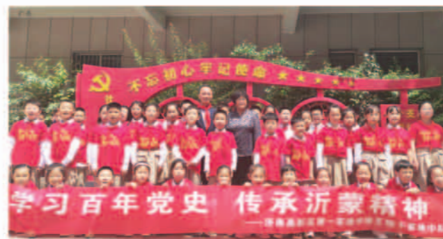
学党史 传承沂蒙精神

学校发展中坚持以人为本，德育为先，弘扬真善美，激发正能量；以机制生动力，科研兴学校，创设环境，教育无痕；引领师生“让优秀成为习惯！”“人人都是发展的主人，处处都体现和谐文明”。