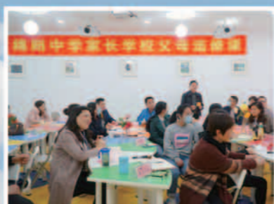
家长学校选修课程