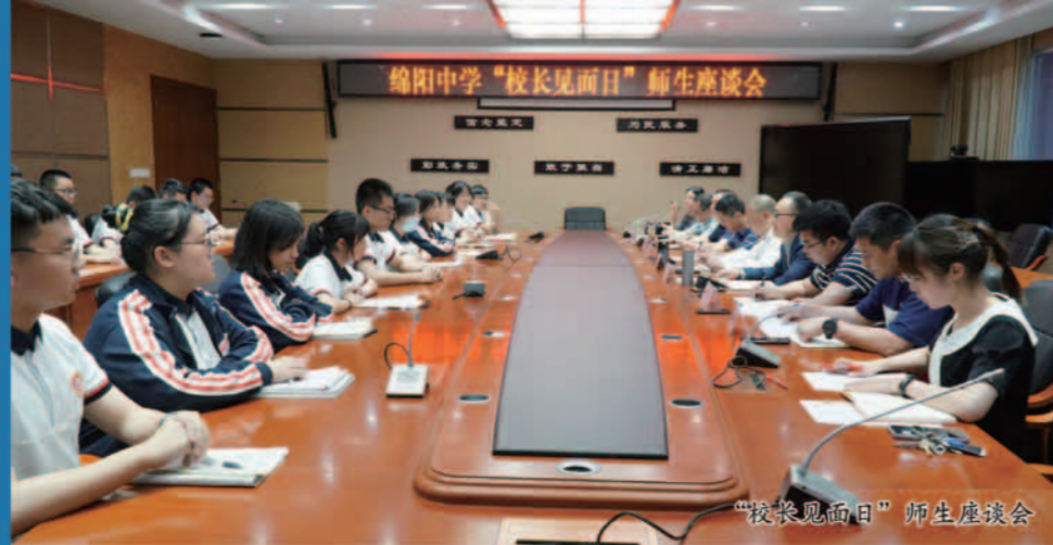
“校长见面日”师生座谈会