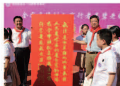
全国立德树人践行者走进校园

学校致力“尚德立人”、做“真教育”，构建独具特色的德育体系，突出优秀传统文化和国际公民素养教育。学校大力推行“研学一体、师生共成长”四模块学习模式，开设了以弘扬传统文化为主题的“研学旅行”课程。