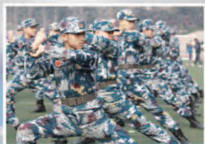
航空实验班学员日常训练