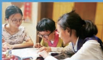
民族教育：“我在顺德有个家——勤奋学习期待佳绩”主题活动

学校占地面积约6.67万平方米，建筑面积约4.27万平方米，按广东省数字化校园标准配备，各种功能场室、体育馆、图书馆等设施设备齐全。学校现有51个教学班，学生2500多人，专任教师191人，教师本科学历达标率100%。