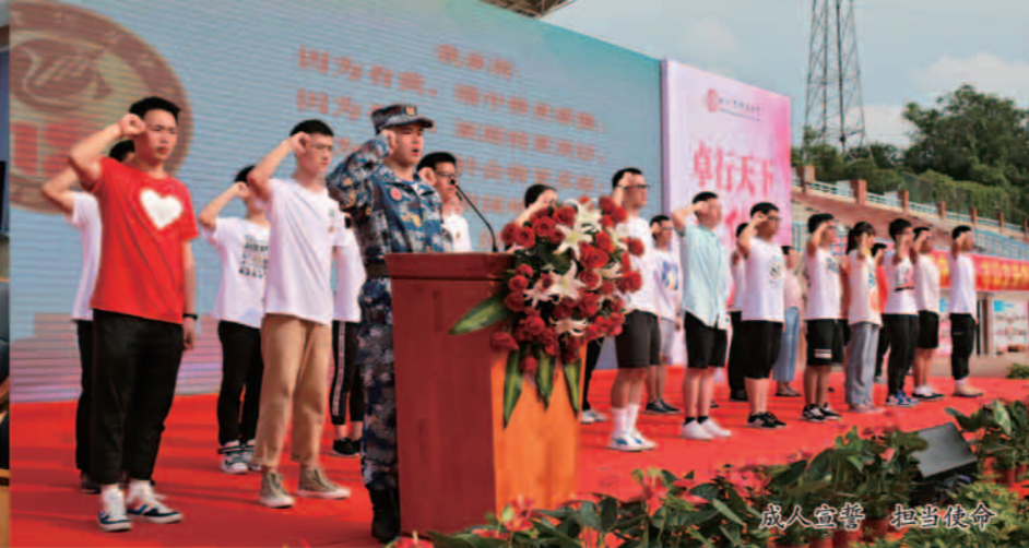
成人宣誓 担当使命