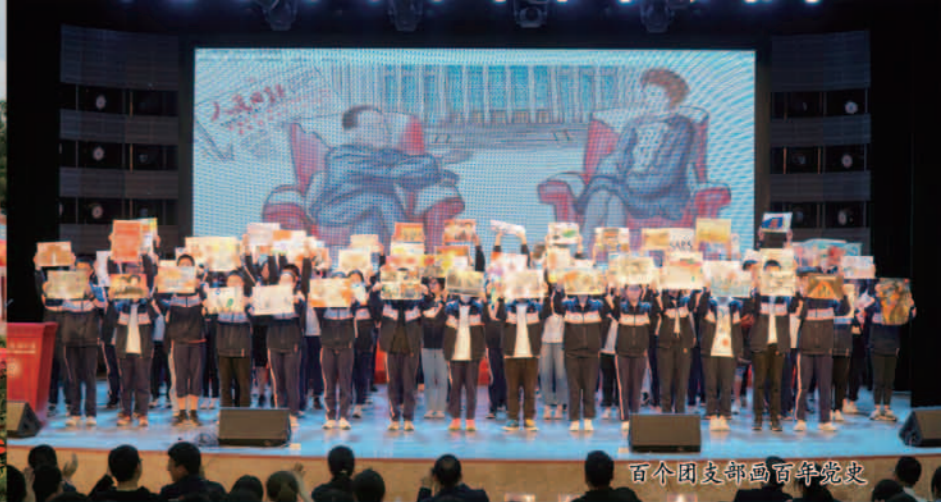
百个团支部画百年党史