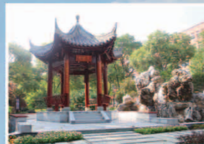
西蜀子云亭下 赓续千年文脉