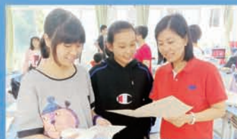
民族教育：结对家庭利用周末时间回校看望学生