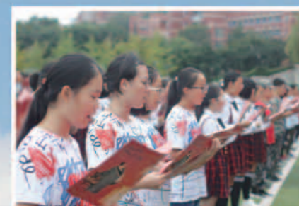
子云雅集 经典诵读