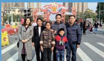
民族教育：“相知融和，共进新年”主题活动