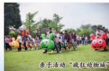
亲子活动“疯狂动物城”