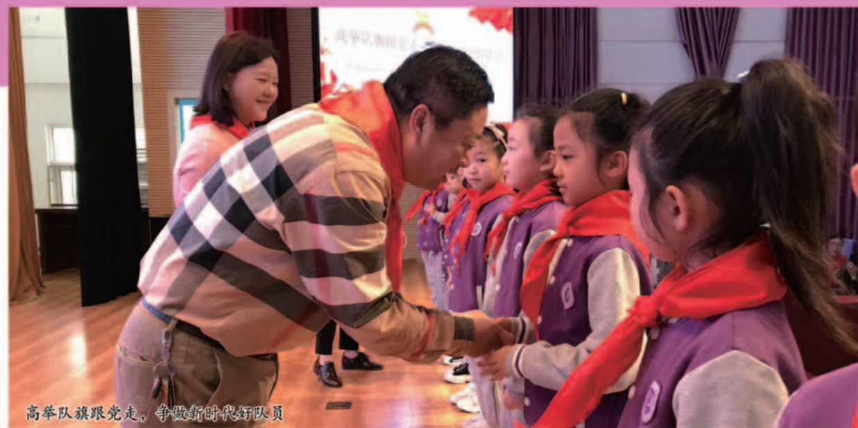
高举队旗跟党走，争做新时代好队员

山东省济南高新区第一实验学校是九年一贯制义务教育学校、山东省文明单位、省级规范化学校。学校成立于2006年7月，位于济南高新区核心区，占地面积53360平方米，建筑面积约3.2万平方米，在校教师306名，有112个教学班，在校学生4725名。