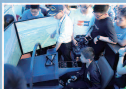
科技体验实践操作